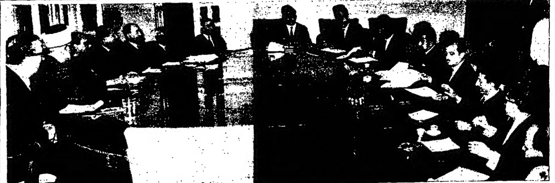
سمو الأمير حسن نائب الملك ولي العهد المعظم يترأس اجتماع مجلس الوزراء الذي عقد مساء أمس في قصر بصرى بعمان